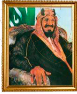
الملك المؤسس طيب الله ثراه