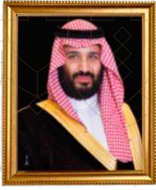
سمو ولي العهد حفظه الله