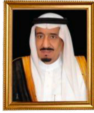
خادم الحرمين الشريفين أيده الله

تكون صورة المؤسس جلالة الملك عبد العزيز - طيب - الله - ثراه - في مكان الشرف في المنتصف وعلى يسار الصورة ( يمين الناظر ) صورة خادم الحرمين الشريفين وتكون صورة سمو ولي العهد على يمين صورة المؤسس ( يسار الناظر ) حسب الرسم اعلاه.